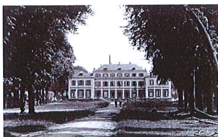
Ancien Château de l'Hôpital Emile-Roux

La communication avec le secrétariat se fera prioritairement par mail.